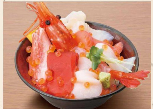
【北海ちらし丼】 1,680 円