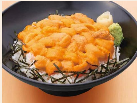
【特選生うに丼】 2,600 円