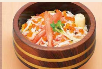
<復刻> 【北海かに丼】 1,480 円