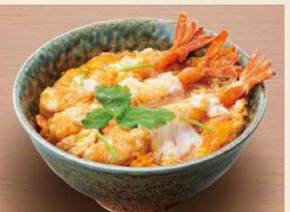
<復刻> 【えび天とじ丼】 1,180 円