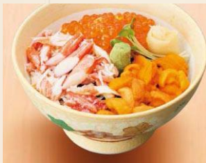
【三色丼】 2,500 円