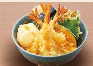
【上天丼】 1,180 円