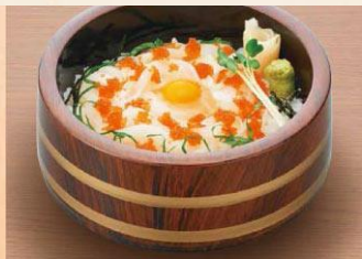
【真いか丼】 1,480 円